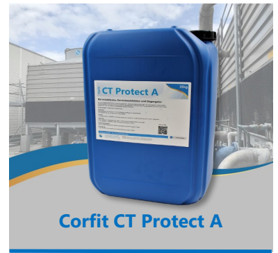
Corfit CT Protect A

Corfit Protect A wird direkt oder mit Wasser verdünnt dem System zugeführt. Es empfiehlt sich die Verwendung einer Dosierpumpe.