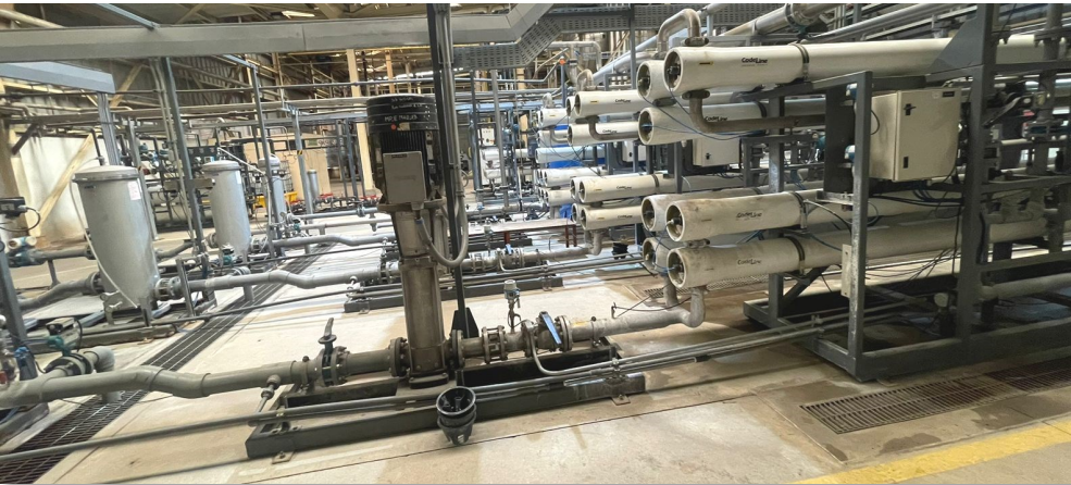
Instalaciones industriales de tratamiento de agua con prefiltros (izquierda) y filtros de membranas (derecha)

MC-S es compatible con los desinfectantes Sanosil para un tratamiento conjunto o combinado para la eliminación adicional de microorganismos y biopelículas.