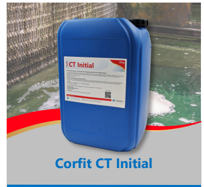
Corfit CT Initial

(Nota: si el uso continuo además del efecto dispersante requiere estabilización de dureza y protección anticorrosiva, recomendamos nuestros productos combinados Corfit CT Closed o Corfit CT Protect . Las documentaciones de estos productos se obtienen por separado).